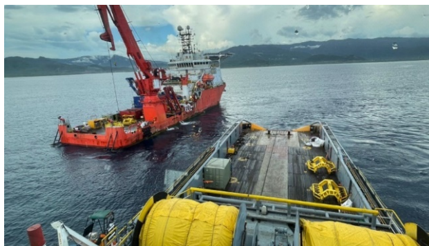
Gambar 2. AHTS Logindo Energy & DSV Fire Opal Sumber : Dokumentasi Peneliti (2023)

Dynamic Positioning (DP) bekerja dengan mengandalkan sistem navigasi berbasis komputer yang menggunakan sensor, GPS, serta referensi posisi lainnya untuk menyesuaikan pergerakan kapal secara real-time . Sistem ini mampu mengoreksi posisi kapal secara otomatis dengan mengendalikan mesin pendorong dan sistem kemudi, sehingga kapal tetap berada di lokasi yang diinginkan meskipun terdapat gangguan eksternal seperti gelombang, arus, dan angin