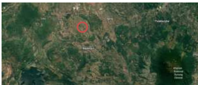
Gambar 2, Peta Kabupaten Majalengka