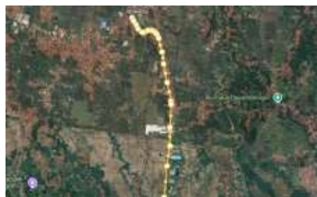
Gambar 3, Peta Lokasi Penelitian